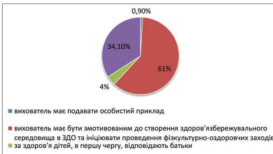
Рис. 2.1. Оцінка ролі педагога-вихователя у формуванні, збереженні та зміцненні фізичного, психічного, соціального, морально-духовного здоров'я дітей дошкільного віку (за самооцінками студентів)

На запитання анкети «чи знайоме Вам таке поняття як «здоров'язбережувальне