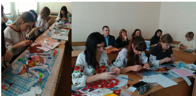
Фото 5, 6. Робота студентів над завершенням образу виготовлення додаткових елементів для ляльки

Створення ляльки – акт творчого самовираження, тому завершення роботи над лялькою – завжди свято для автора. У «Майстерні ляльок» ритуал завершення – це презентація з фотосесією нової ляльки і лялькаря. Працюючи з лялькою, особистість «з'єднується» з образом, «передає» йому свої почуття, відкриває в собі приховані ресурси, може вільно транслювати оточуючим свої потреби. Саме в цьому дивовижному перевтіленні педагогічного партнерства полягає основний принцип лялькотерапії.