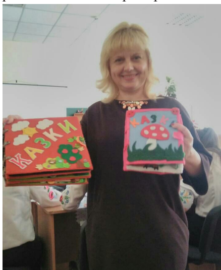
Фото 3. Розгляд казкових персонажів