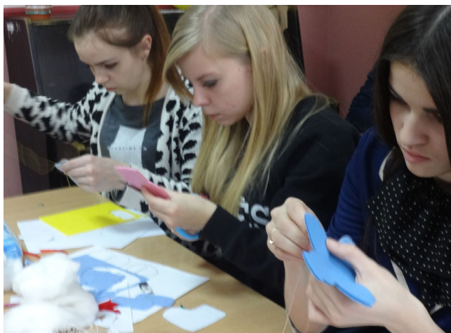
Фото 4. Творчий процес – пошиття ляльки

3. Завершення образу за рахунок використання додаткової атрибутики: прикраси, відмінна символіка.