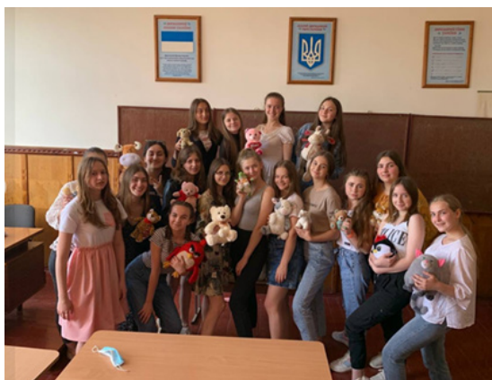
Фото 1, 2. Знайомство «Улюблена лялька мого дитинства»